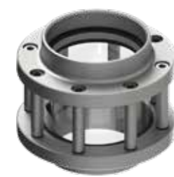
▶ WIZUALIZATORY VISUALISERS