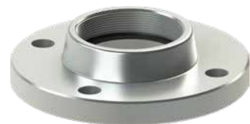
▶ KOŁNIERZE FLANGES