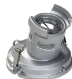
▶ SPRZĘGACZE API API COUPLINGS