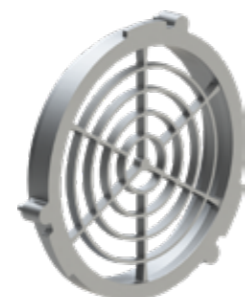
▶ ZŁĄCZKI WENTYLACYJNE VENTILATION COUPLINGS