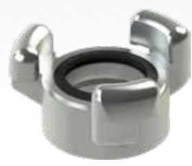
▶ ZŁĄCZKI BARCELONA BARCELONA COUPLINGS