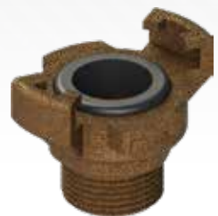
▶ SZYBKOZŁĄCZKI EXPRESS COUPLINGS